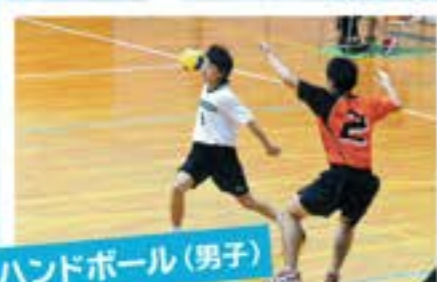
ハンドボール(男子)