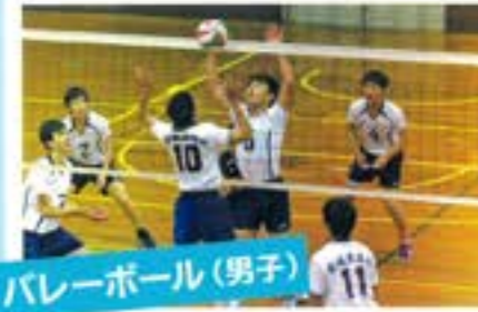
バレーボール(男子)