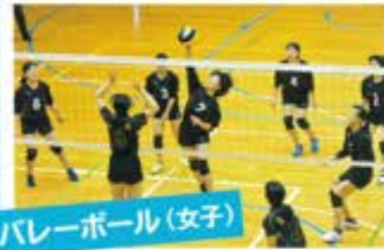
バレーボール(女子)