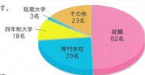
【令和4年度 卒業生 進路決定先】