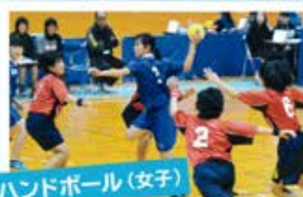
ハンドボール(女子)

「まず一勝」は達成！次の「一勝」に向けて、ハンドボール的に仲良く頑張っています。