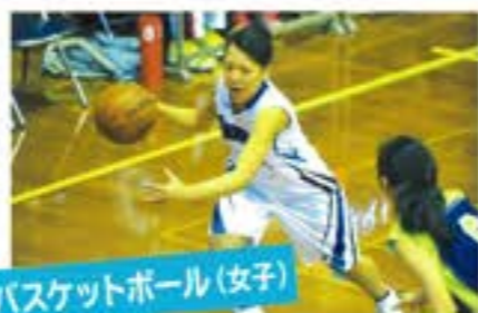
バスケットボール(女子)

みんなから「応援されるチームになる」ために日々の積み重ねを大切に人として成長しています。