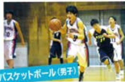
バスケットボール(男子)

みんなから「応援されるチームになる」ために日々の積み重ねを大切に人として成長しています。